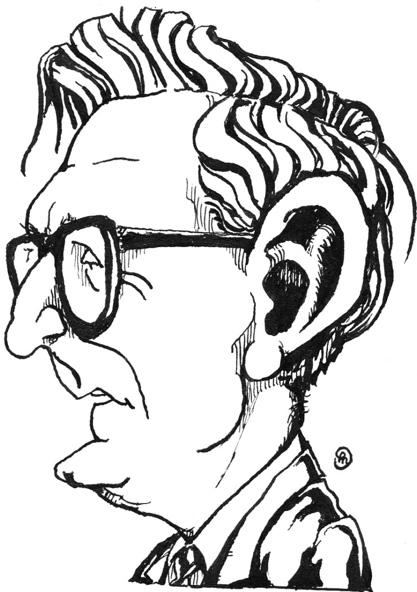
Karikatuur van Berkhof (1975). Getekend door Herman Nauta voor InFormatie, het blad van de Leidse Studenten Ekklesia.