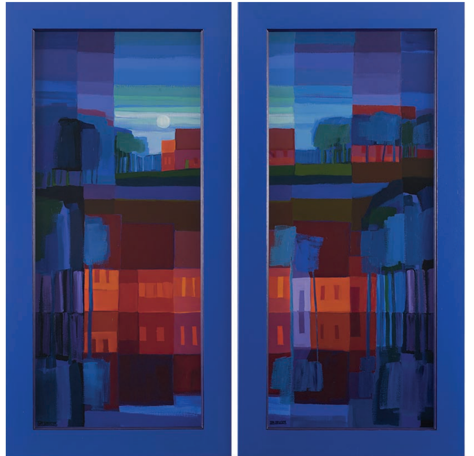
Aan de waterkant, 2004. 140 x 70, tweelulk.