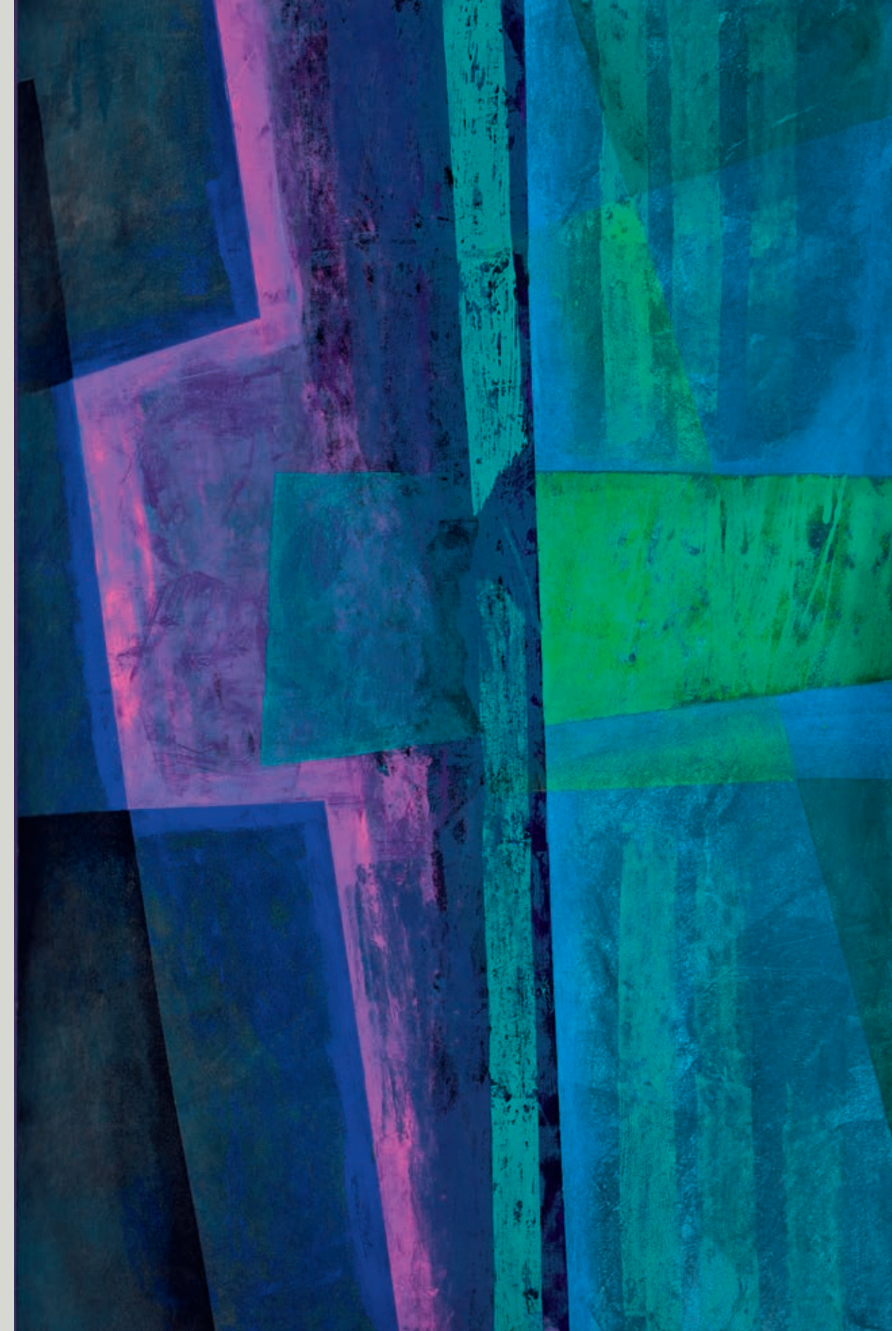
Tussen leven en dood, 1991. 150 x 92 cm.