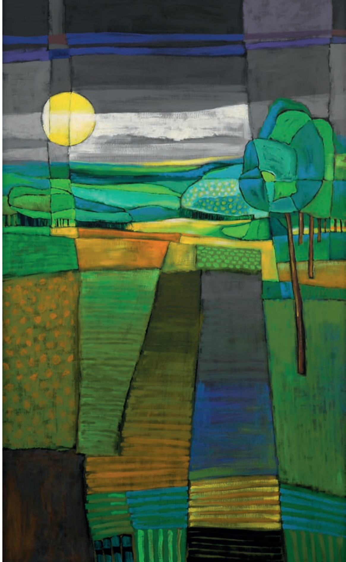
Akkerlandschap Twente, 1995. 236 x 116 cm.