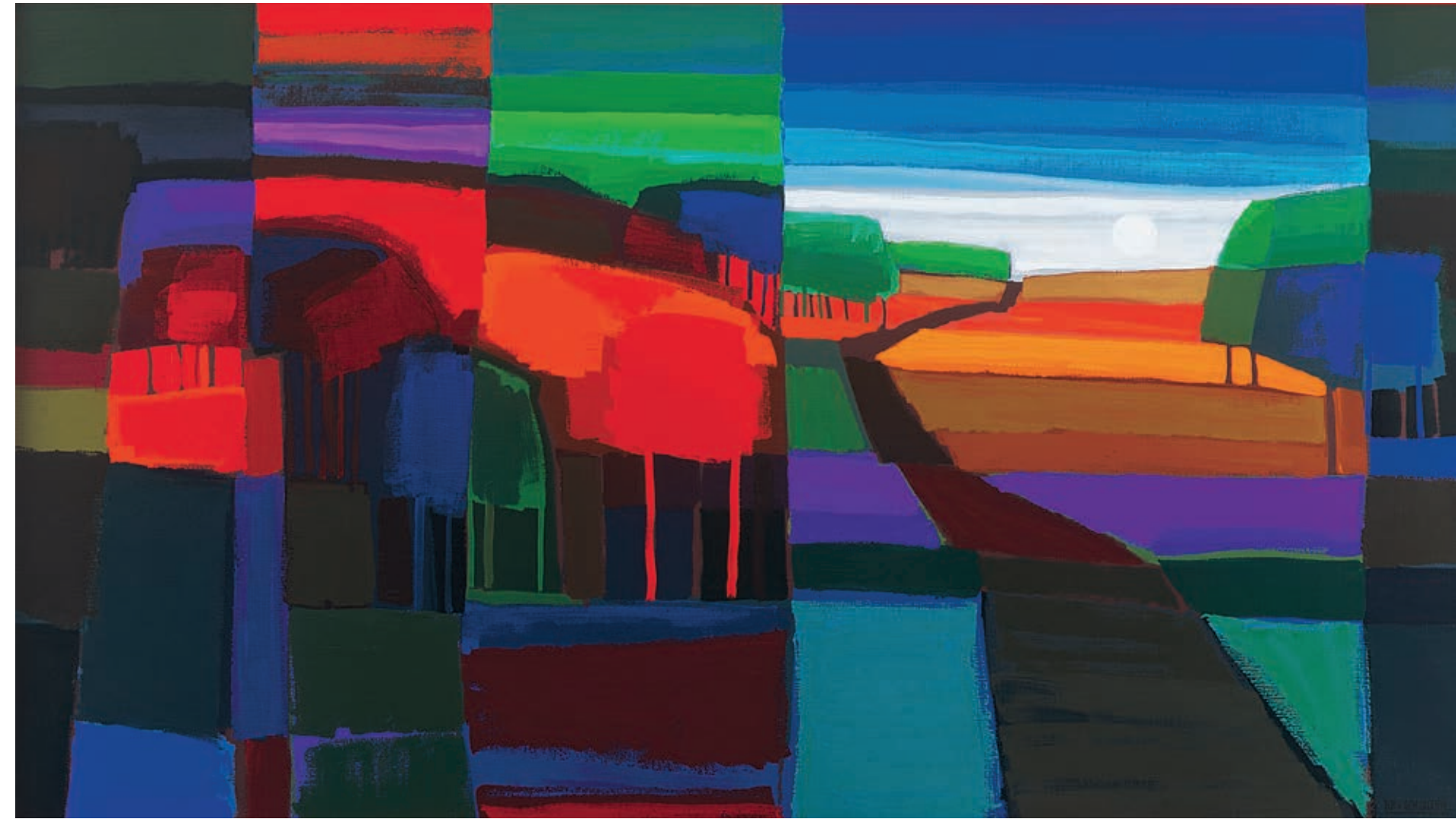
De lange weg, 2001. 108 x 178 cm.