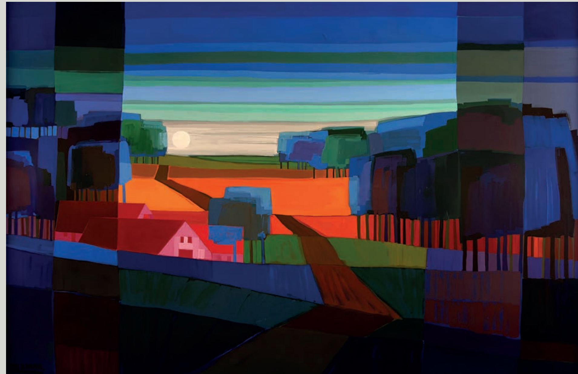
Goudgele essen, 2006. 200 x 300 cm.