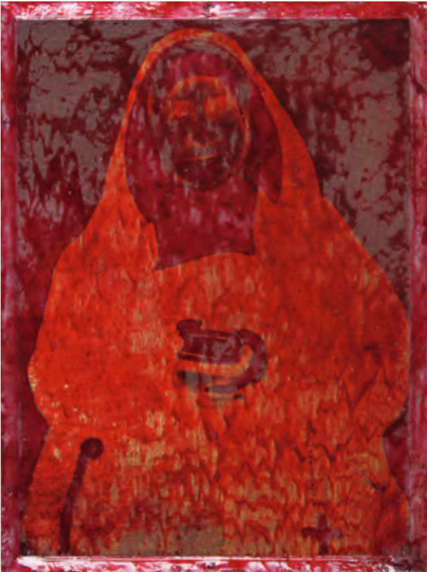
Cliché van het gangbare fotoportret van moeder Trees bij de zusters van Steenberg (materiaal: rode ets op zink).