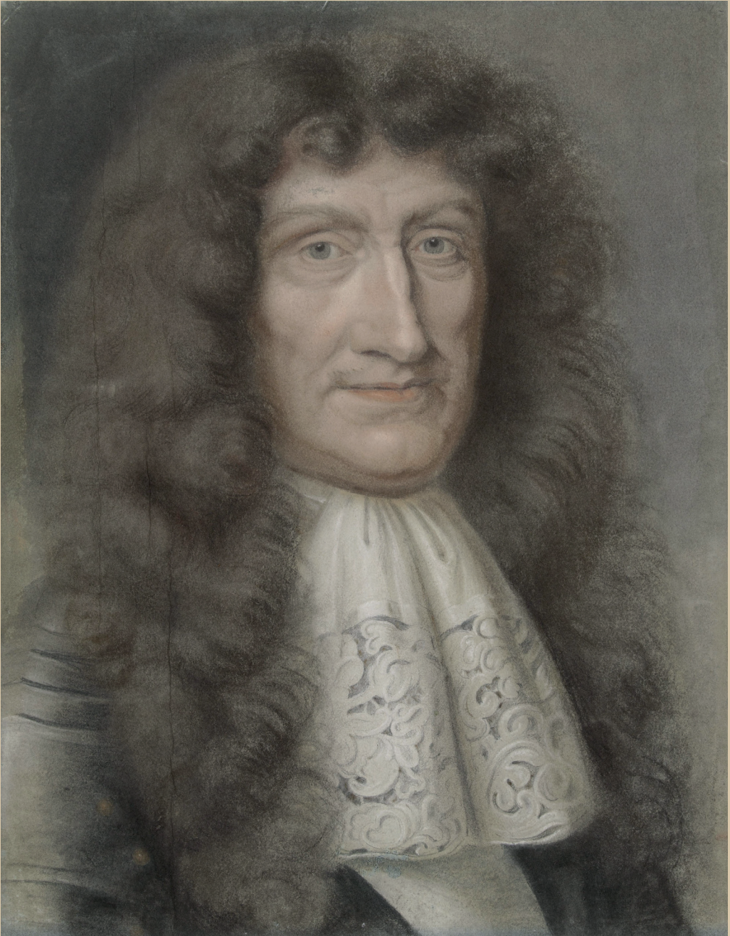
Wallerant Vaillant, Louis Godefroi d'Estrades (ca. 1647-1677). Rijksmuseum, Amsterdam. Louis Godefroi d'Estrades was verschillende keren ambassadeur van Frankrijk in de Republiek, onder meer tijdens het bewind van Johan de Witt tussen 1662 tot 1668.