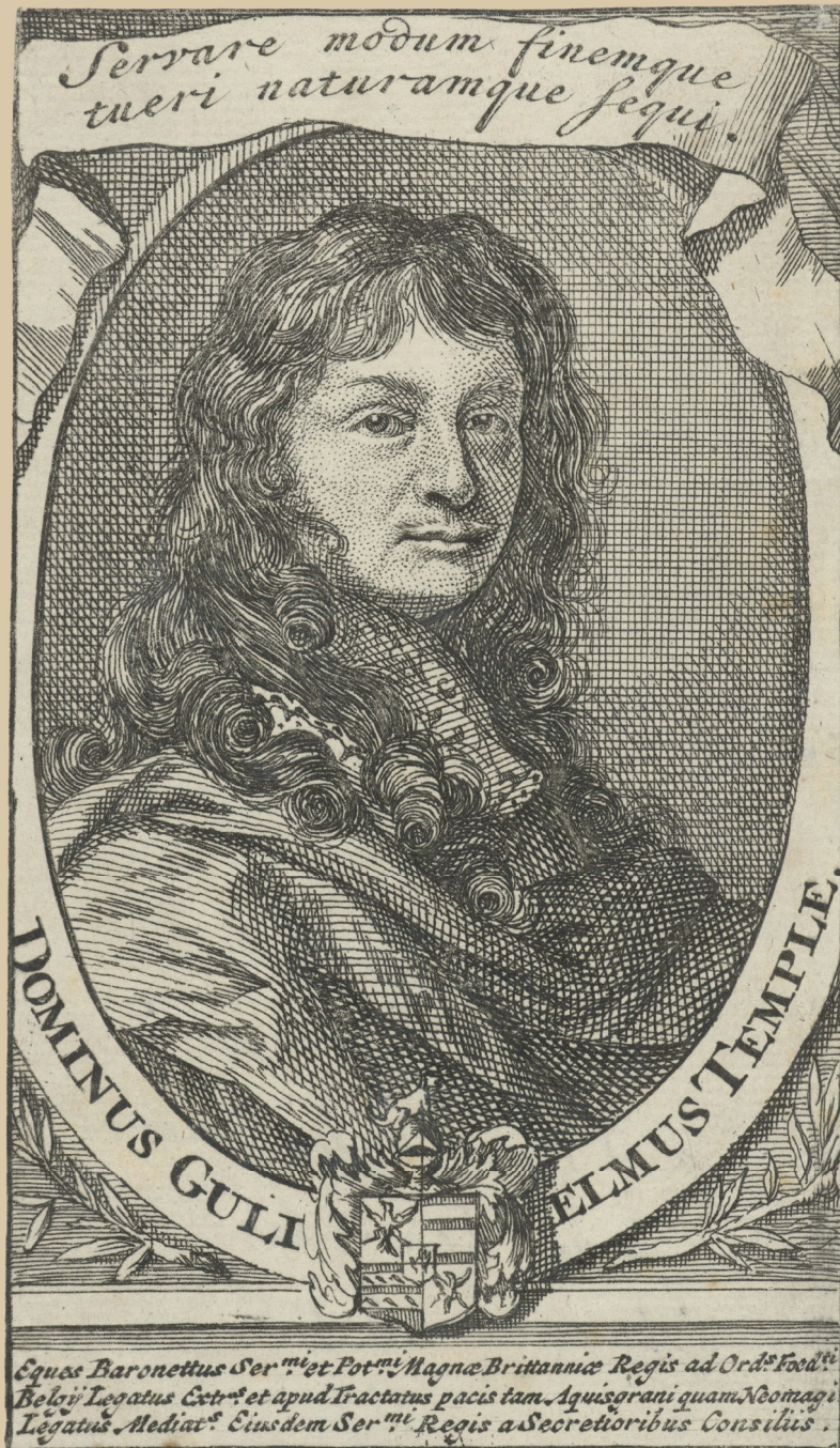
Casper Luyken, William Temple (1695). Rijksmuseum, Amsterdam. De Engelse ambassadeur William Temple schreef na zijn gezantschap in Den Haag een scherts van de Republiek. Temple had veel sympathie voor De Witt en voor de Nederlanders en om die reden werd hij vlak voor het Rampjaar teruggeroepen naar Londen.