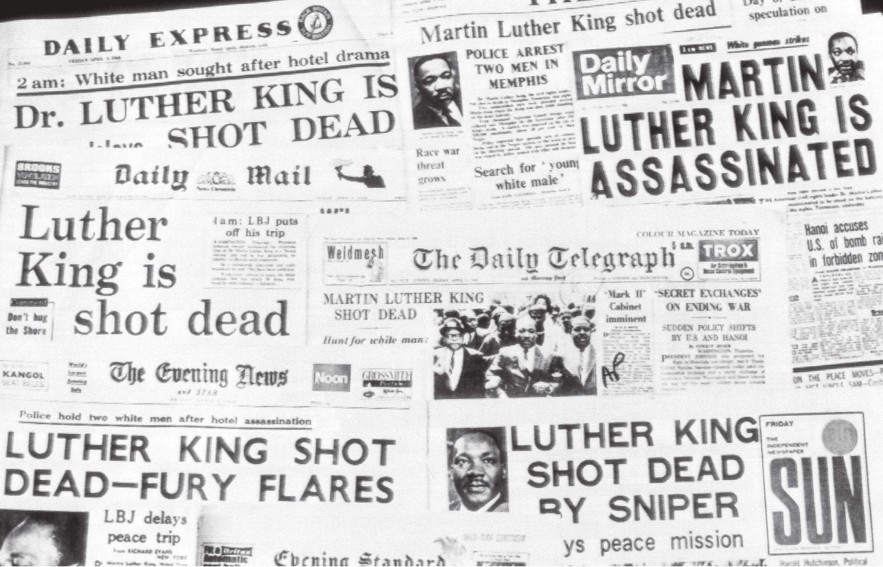
King doodgeschoten! Wereldwijd voorpaginanieuws

en ronduit gevaarlijk. Toen begin februari twee zwarte vuilnismannen omkwamen tijdens hun werk was de maat vol. King en Abernathy werden gevraagd om tijdens de staking te komen spreken. Dat deden ze. Het was inspirerend en motiverend. Maar het was ook weer gevaarlijk, gespannen. Ondanks al hun pleidooien voor geweldloosheid en hoe je provocaties kunt weerstaan, waren er relschoppers aanwezig en de demonstratie escaleerde.