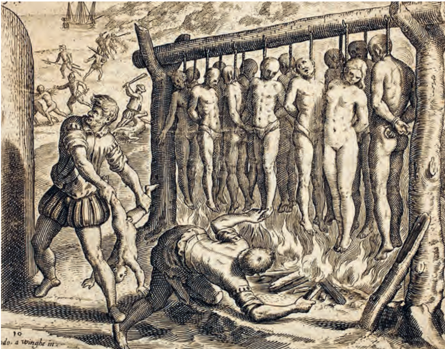
1 Jean Théodore de Bry, Conquistadors attaquant un village d'Indiens. Scène de pendaisons et bûcher (gravure), (BNF C43324). De gravure werd gemaakt voor een uitgave van de Brevísima relación de la destrucción de las Indias door de dominicaan Bartolomé de las Casas.

Het nagenoeg volledig uitsterven van de Amerikaanse volkeren vond vooral plaats vóór het bewind van Filips II. Eén epidemie springt er echter uit. De Nahuas van Centraal-Amerika werden rond 1520 het slachtoffer van pokken (ca. 8 miljoen doden), evenals van twee pieken van een onbekende epidemie, vanaf 1545 (12 tot 15 miljoen doden) en vervolgens vanaf 1576 (ca. 2 miljoen doden). In de Nahuatl-taal wordt die ziekte cocoliztli genoemd.