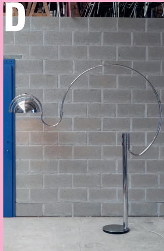
Chromen booglamp met uniek ontwerp door onbekende producent en ontwerper