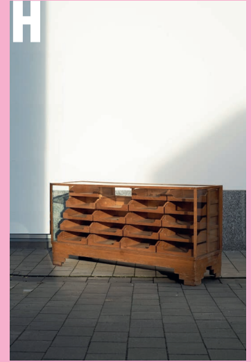
H Eiken toonbank geproduceerd door Dudley & Co Ltd. in de jaren 1920 in Engeland