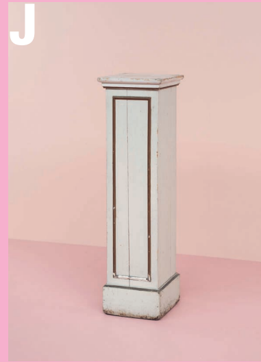
J 19de eeuwse zuil uit hout en plaaster