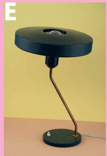
Bureaulamp Romeo ontworpen door Louis Kalff en geproduceerd door Philips