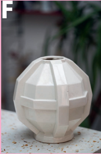
F Honderdjarige decoratieve keramische vaas met elementen in art-decostijl