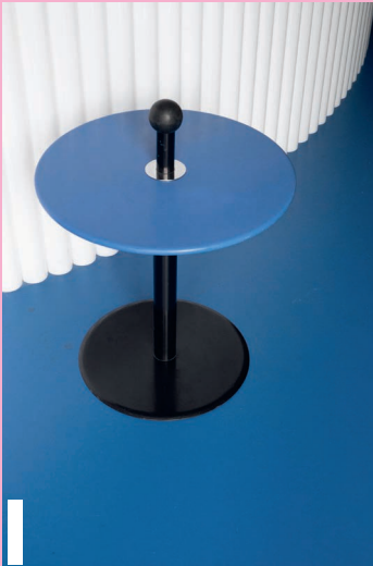
I Salontafel geproduceerd door IKEA in de jaren 1980 geïnspireerd op de Memphis-beweging