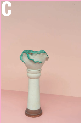
Keramische zuil met bijbehorende bloempot