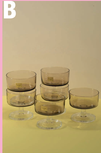
Fumé champagne-glazen geproduceerd door Arcoroc in de jaren zeventig