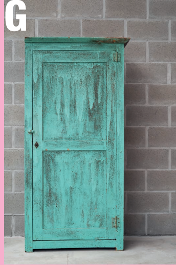
G Oude houten geschilderde kast afkomstig uit een oud atelier met mooi uniek patina