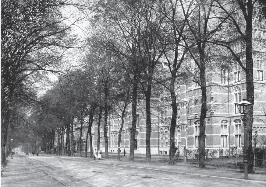
Het pas geopende Canisius College te Nijmegen in het jaar dat Lutkie het bezocht, 1900.

ringen te hebben gebaseerd: ‘En onder de broeders en zusters bekleedt de oudste vaak een heel bijzondere plaats. [...] Het leven van de oudste is gemeenlijk van de aanvang af, zwaarder, zowel in geestelijk als in lichamelijk opzicht. Dit kind moet worden ter wereld gebracht, gevoed, verzorgd door eene nog onervaren moeder. Op het oudste der kinderen worden het eerst alle “proeven” genomen. Niet enkel proeven van lichamelijke opvoeding; evenzo van meer geestelijke aard. Als de ouders tot strengheid geneigd zijn, dan passen zij de volle mate hunner gestrengheid toe op het oudste kind. [...] Is de oudste ’n jongen, dan is hij al gauw “onmisbaar”, óf voor vader in de zaak, óf voor aanvulling van het inkomen tot onderhoud der familie. Ook voor hem geen rustig beramen van toekomstplannen, geen voldoende voorbereiding op het verdere leven.’ 5