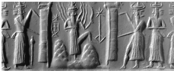
Afb. 9: Rolzegel (Brits Museum), Oud-Akkadische periode (ca. 2300-2200 voor Chr.).