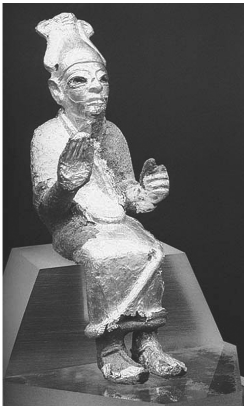
Afb. 8: Met goud bedekt beeldje van El uit Ugarit. Hij heft zijn rechterhand op in een zegendend gebaar. Zijn linkerhand zal vermoedelijk een gouden beker omvat hebben (Damascus Museum, Inv. 3573). 91

Hij zegende zijn knecht met nadruk, El zegende Kirtu de edelman, sterkte de beminnelijkste van de jongelingen van El. (KTU 1.15:II.14-20)