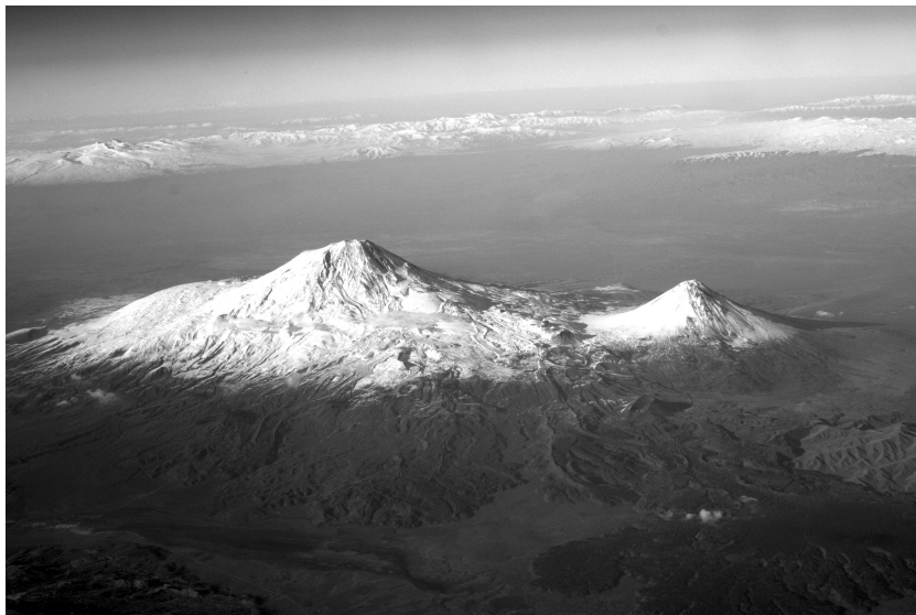
Afb. 7: De berg Ararat, de berg van El, met aan de rechterkant de kleine Ararat, gezien vanaf Turkse kant.

wel aangeduid als El Sjaddai ‘God, de bergbewoner’ (Day 2000, 32-34). Het gebied van Armenië is door een aantal bijbelonderzoekers al eerder voorgesteld voor de oorspronkelijke ligging van de Hof van Eden. 84