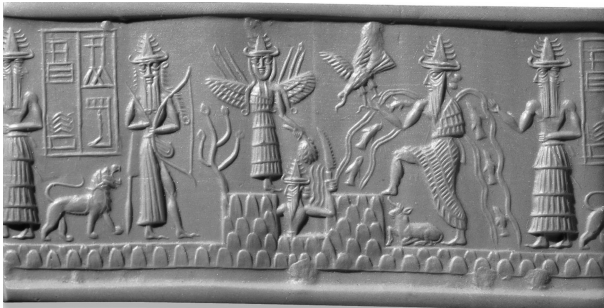
Afb. 10: Rolzegel (Brits Museum), Oud-Akkadische periode (ca. 2300-2200 voor Chr.). De zonnegod lijkt af te dalen tussen de tweelingbergen in.

De afbeelding van het zegel hieronder (afb. 10) wordt gewoonlijk zo uitgelegd dat de zonnegod oprijst vanuit de tweelingbergen, maar het is evengoed mogelijk dat hij hier juist neerdaalt in de aarde. De god die zijn voet op de berg plaatst is weer de scheppergod Enki/Ea. Twee rivieren (Eufraat en Tigris), vol met vis, glijden van zijn schouders. De gevleugelde godin op de andere bergtop is Inanna/Ishtar, godin van liefde en oorlog. Er groeit een boom vanuit haar bergtop, en ze reikt een tros dadels naar beneden naar de zonnegod voordat deze afdaalt voor zijn nachtelijke tocht door de aarde.