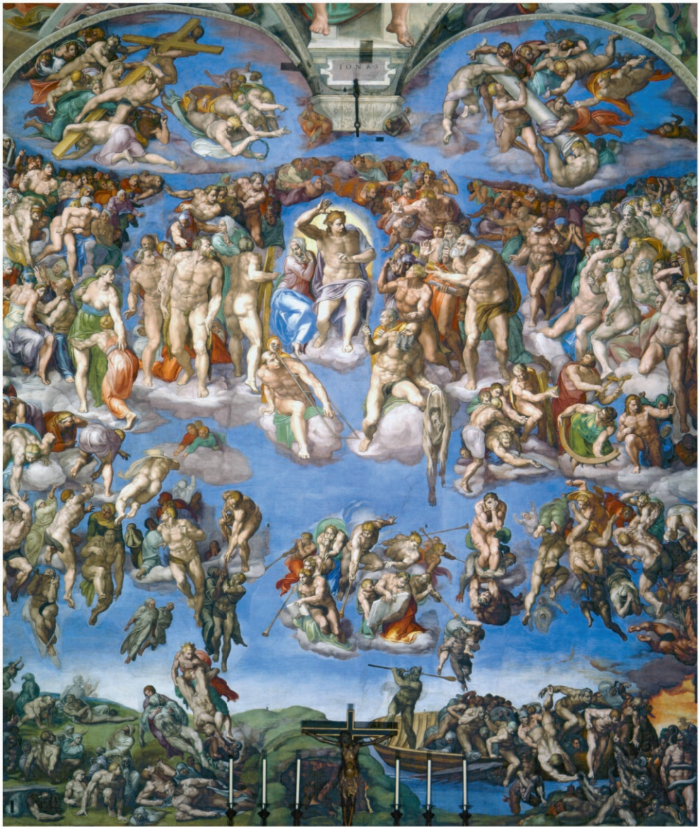
MICHELANGELO, LAATSTE OORDEEL , 1536-1541

De prachtige mensengedaanten op dit befaamde schilderij in de Sixtijnse Kapel van het Vaticaan in Italië illustreren de dunne grens die bestond tussen het gewijde en het profane in de zestiende eeuw.