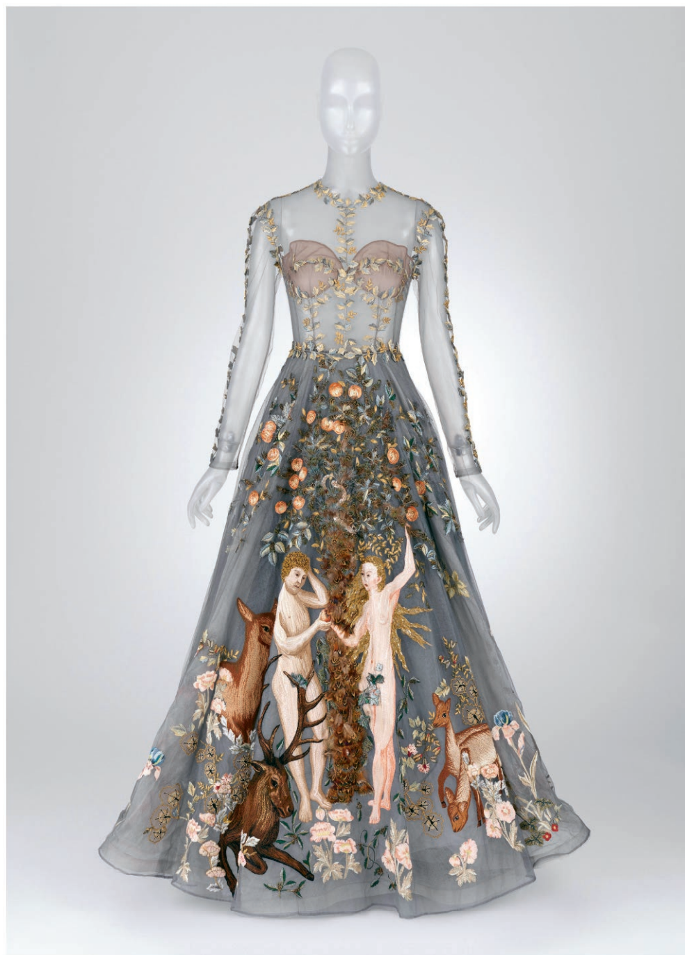
AVONDJURK, VALENTINO, LENTE/ ZOMER 2014

Deze jurk is een echo van het minutieus gedetailleerde borduurwerk uit de middeleeuwen, met Adam en Eva in het paradijs tussen de overvloed aan flora en fauna.