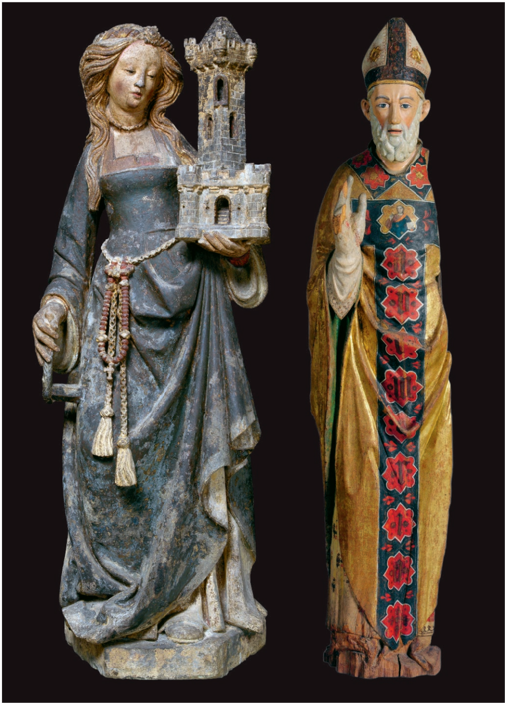
STANDBEELDEN VAN SINT-BARBARA, CA. 1500 EN SINT-NICOLAAS, CA. 1350-1375

Laatmiddeleeuwse devotieobjecten zouden de aandacht vestigen op het feit dat ze een voorwerp zijn, door de materialen te benadrukken waarvan ze zijn gemaakt, zoals hout, verf en bladgoud.