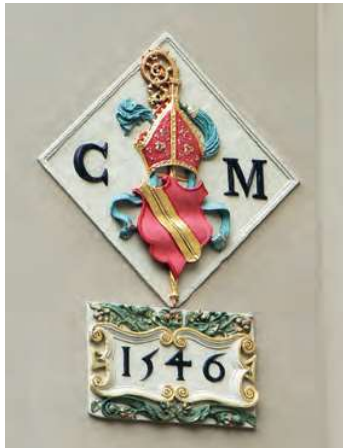
De Abdi Heeswijk-Dinther werd in 1546 opnieuw opgetrokken.