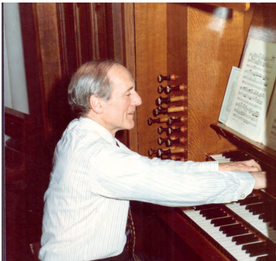
Francis Jackson aan het Nicholson-orgel in Schagen, 1981.