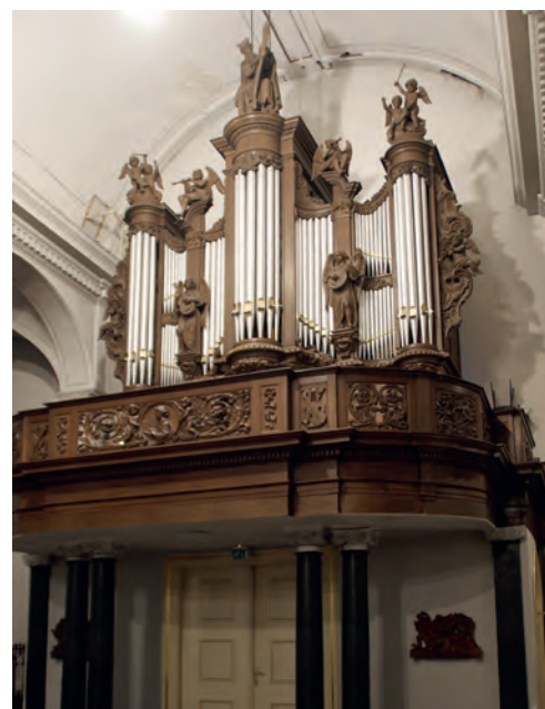
De orgels van Smits in Someren en Loret in Waspik.

TEKST: FRANS JESPERS