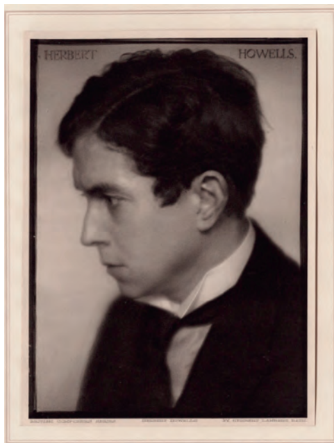
Een jonge Herbert Howells, een paar jaar nadat hij zijn eerste set psalmpreludes componeerde.

Het toeval wil dat de genoemde Three Psalm Preludes mijn eerste kennismaking vormden met Howells' orgelmuziek. Achteraf een heel gelukkig toeval omdat de drie preludes een makkelijke toegankelijkheid paren aan een grote diepzinnigheid, muziek dus waar je snel door gegrepen kunt worden en die tegelijkertijd getuigt van een rijke muzikale inhoud. Het laatste geldt voor alle muziek van Howells, het eerste niet. Om mij tot de orgelmuziek te beperken, ook met de nu eens dromerige, dan weer imposante Rhapsody nr. 1 (1915), met het plechtstatige karakter van Master Tallis's Testament (1940), of met de vriendelijke Dalby's Fancy (1959) zal geen luisteraar moeite hebben, de weerbarstige Sonata (1933) of de eigenzinnige Rhapsody nr. 4 (1958) daarentegen geven hun geheimen niet zo makkelijk prijs en zouden daarom kunnen afschrikken.